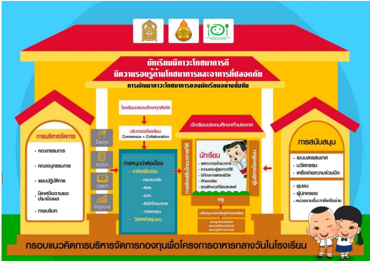
แผนภาพประกอบที่ 1 แสดงแนวคิดในการบริหารจัดการกองทุนเพื่อโครงการอาหารกลางวันในโรงเรียนประถมศึกษา