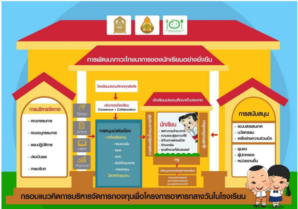
แผนภาพประกอบที่ 1 แสดงแนวคิดในการบริหารจัดการกองทุนเพื่อโครงการอาหารกลางวันในโรงเรียนประถมศึกษา